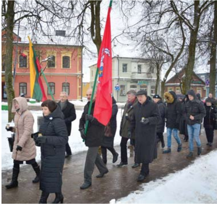
Iš bažnyčios anykštėnai kartu keliavo iki paminklo Laisvei.

Sekmadienį, sausio 13-ąją, anykštėnai minėjo Laisvės gynėjų dieną. Šventinis renginys vyko Anykščių šv.Mato bažnyčioje. Miesto centre, prie paminklo Laisvei, šiais metais tik sugiedotas himnas ir iškelta valstybinė vėliava.