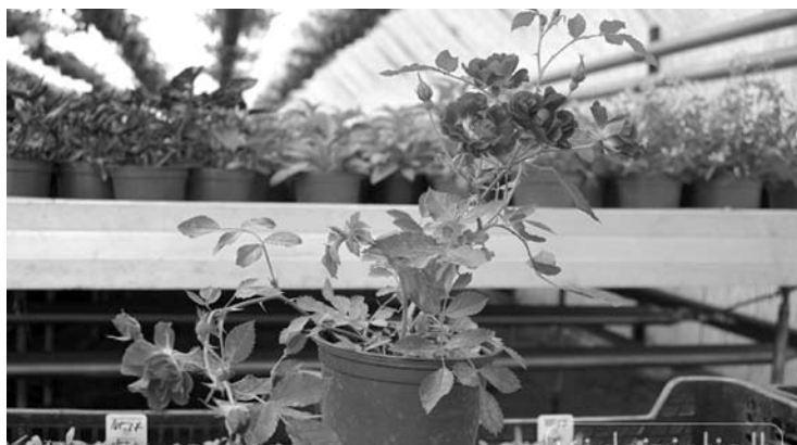
Miestą puoš „Josvainių gėlės“.