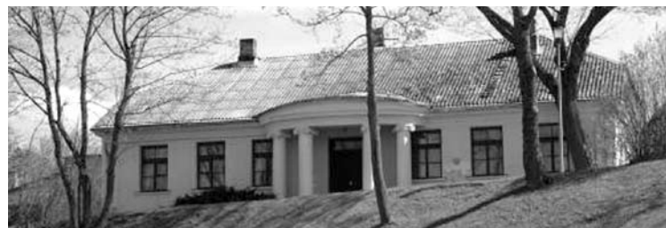
Okuličiūtės dvarelyje rekonstrukcijos metu atkastas rūsys – jį taip pat ruošiamasi įveikinti.

Okuličiūtės dvarelis rekonstrukcijos darbai bus tęsiami mažiausiai iki šių metų balandžio mėnesio. Pernaį gruodžio pabaigoje Anykš-