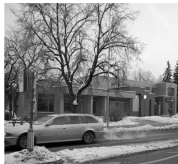
Senasis Anykščių knygyno pastatas po to, kai buvo nupirktas, naujam gyvenimui per dešimtmetį taip ir nebuvo prikeltas.