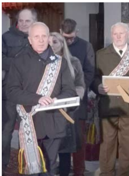
Kraštietis, generolas Jonas Andriūškevičius - pirmasis Lietuvos kariuomenės kūrėjas ir pirmasis jos kariuomenės vadas.